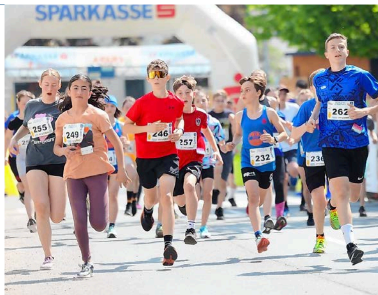
▲ Beim Sparkasse-Lauf in Bad Erlach waren am Sonntag fast 400 Kinder und Jugendliche unterwegs.